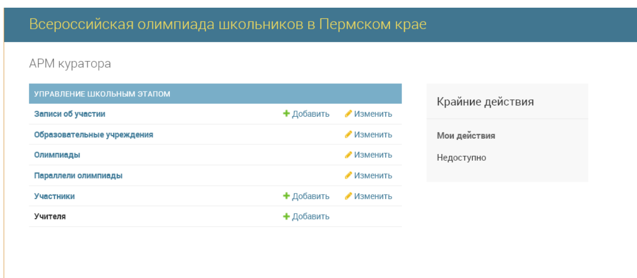
Рисунок 2. Главная страница приложения

После входа в систему откроется главная страница приложения.