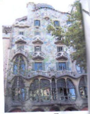
Дом Бальо, Барселона