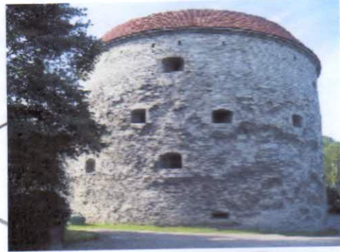
Толстая Маргарита, Таллинн