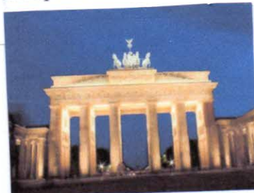
Бранденбургские ворота, Берлин