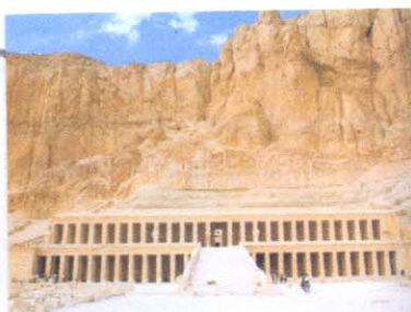
Храм Хатшепсут, Луксор