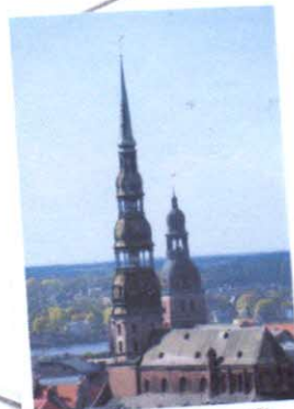
Рига, Церковь Св. Петра