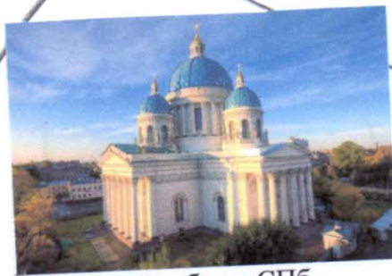
Троицкий собор в СПб