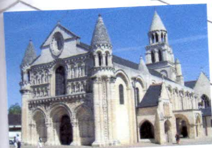
Нотр-Дам-ля-Гранд, Пуатье, Франция, XI век.