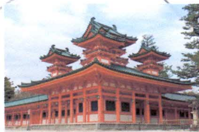
Храм Хэйан-дзингу, Киото