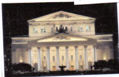
Большой театр, Москва