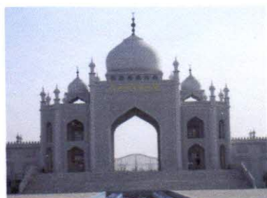
Мечеть в Нинсе