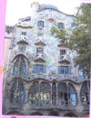
Дом Мило, Барселона.