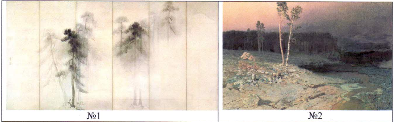
Таблица к заданию 2

3.5. Напишите, как бы Вы разместили два этих произведения в выставочном зале и как бы назвали такую выставку.