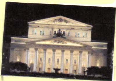
Большой театр, Москва